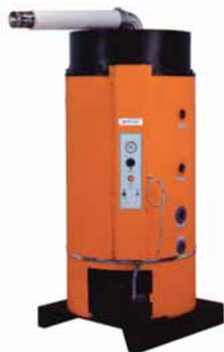
serie GSXSG BG