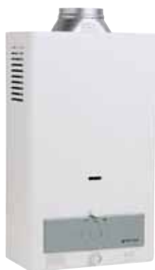
serie IGME b