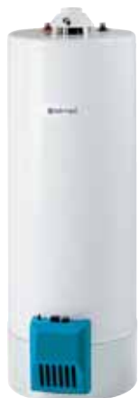
serie EURO GSX