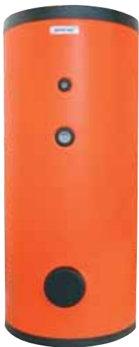
serie WWF 1-2

serie WWF SOFT 2 Bollitore con due serpentini installazione verticale a pavimento - rivestimento interno in poliuretano rigido esterno in PVC GARANZIA ANNI 3