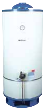
serie EURO GSX BG